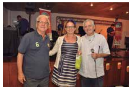
Liesne : 01 Kit de O Boticário