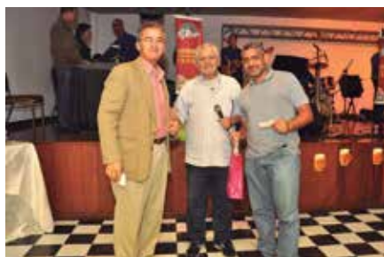
Alexandre: 01 Kit de O Boticário