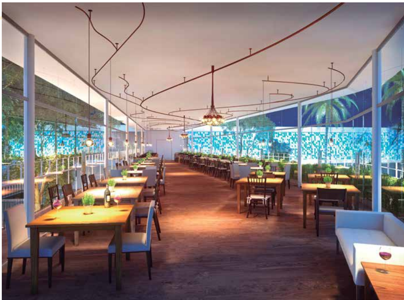
*Novo restaurante dos associados - Passarela superior

Assim, buscando agradar a todos, hoje tem-se o com a opção de pratos executivos, lanches e petiscos atendendo exclusivamente o bar da piscina.