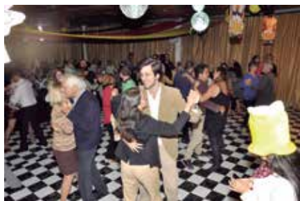
Os casais aproveitando a pista de dança