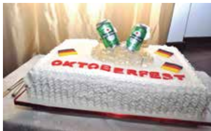
O tradicional bolo de aniversário