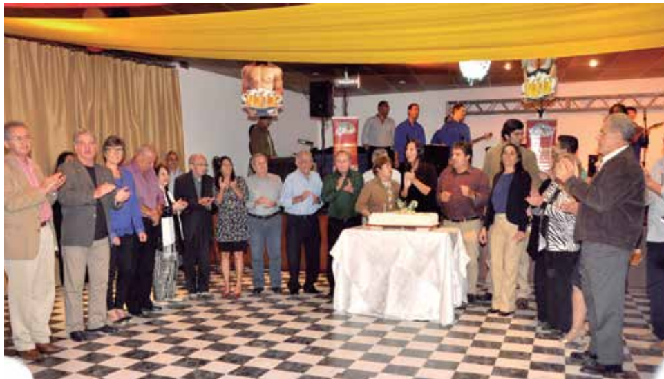
O parabéns pra você!!!

Em novembro, a festa dos aniversariantes será mais cedo na sexta-feira 18 e o tema é a Noite Portuguesa com as atrações Os Típicos da Beira e seu show e mais o consagrado cantor lusitano Mário Simões.