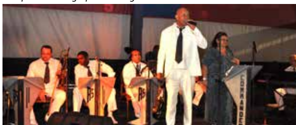
Orquestra Commander em ação