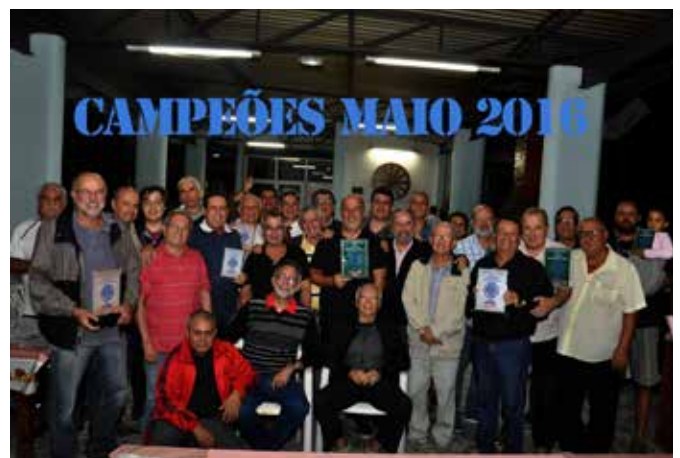
Os campeões dos torneios.