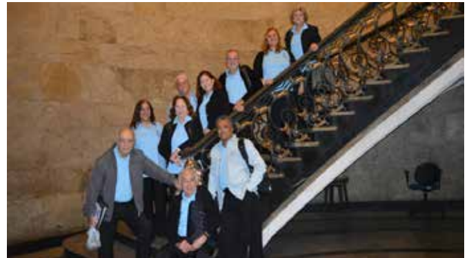
Encontro de Corais Receita Federal, realizado no dia 20.07 no Ministério da Fazenda - RJ