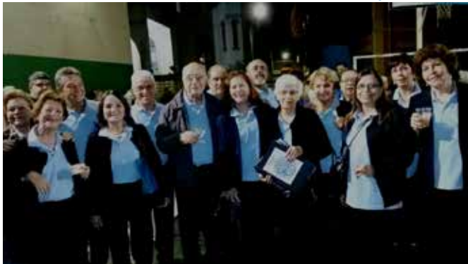
XI Encontro de Corais Dannemann-Siemsen no dia 25.06 no Colégio Imaculada Conceição, em