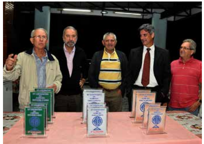
Diretoria da AABB-Rio