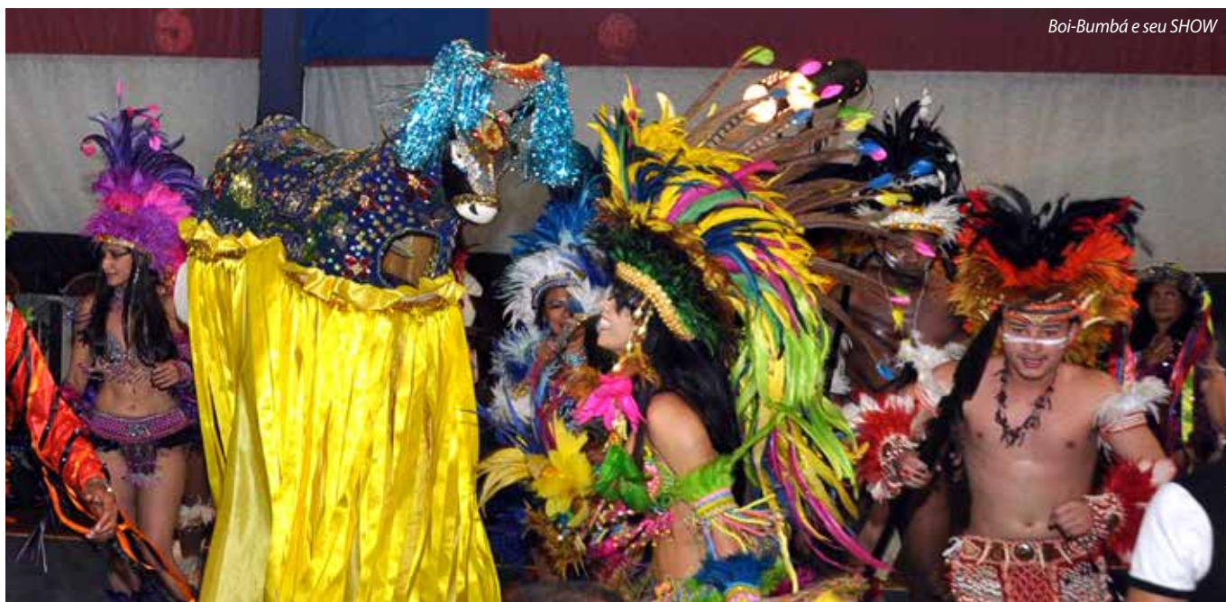
Boi-Bumbá e seu SHOW