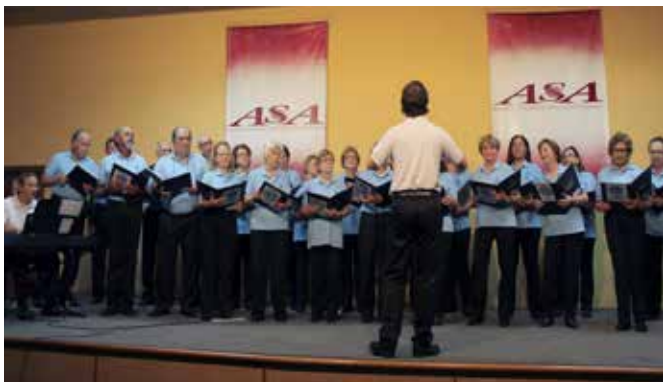
XXI Encontro de Corais ASA (Associação Scholem Aleichem), no dia 03.07, em Botafogo.