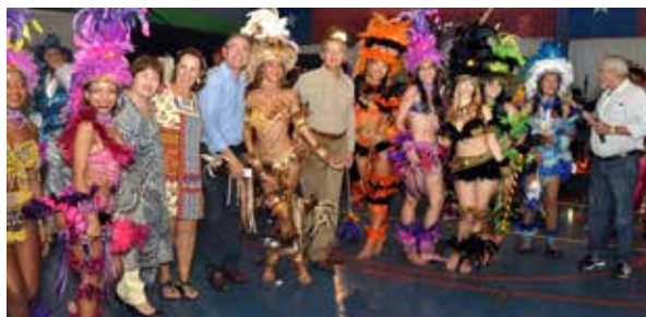
Componentes do grupo com dirigentes da AABB