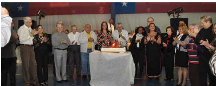
Corte simbólico do bolo

No intervalo a realização dos itens de homenagem aos aniversariantes do mês cantando os "parabéns para vocês", o corte do bolo confeitado e a foto oficial do grupo.