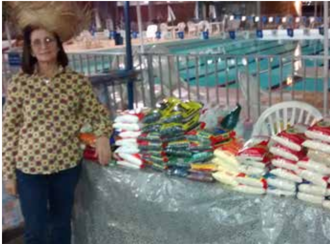
Donativos arrecadados na Festa Junina