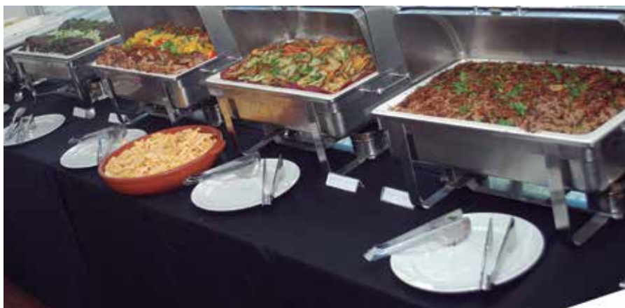
O almoço servido pelo novo buffet