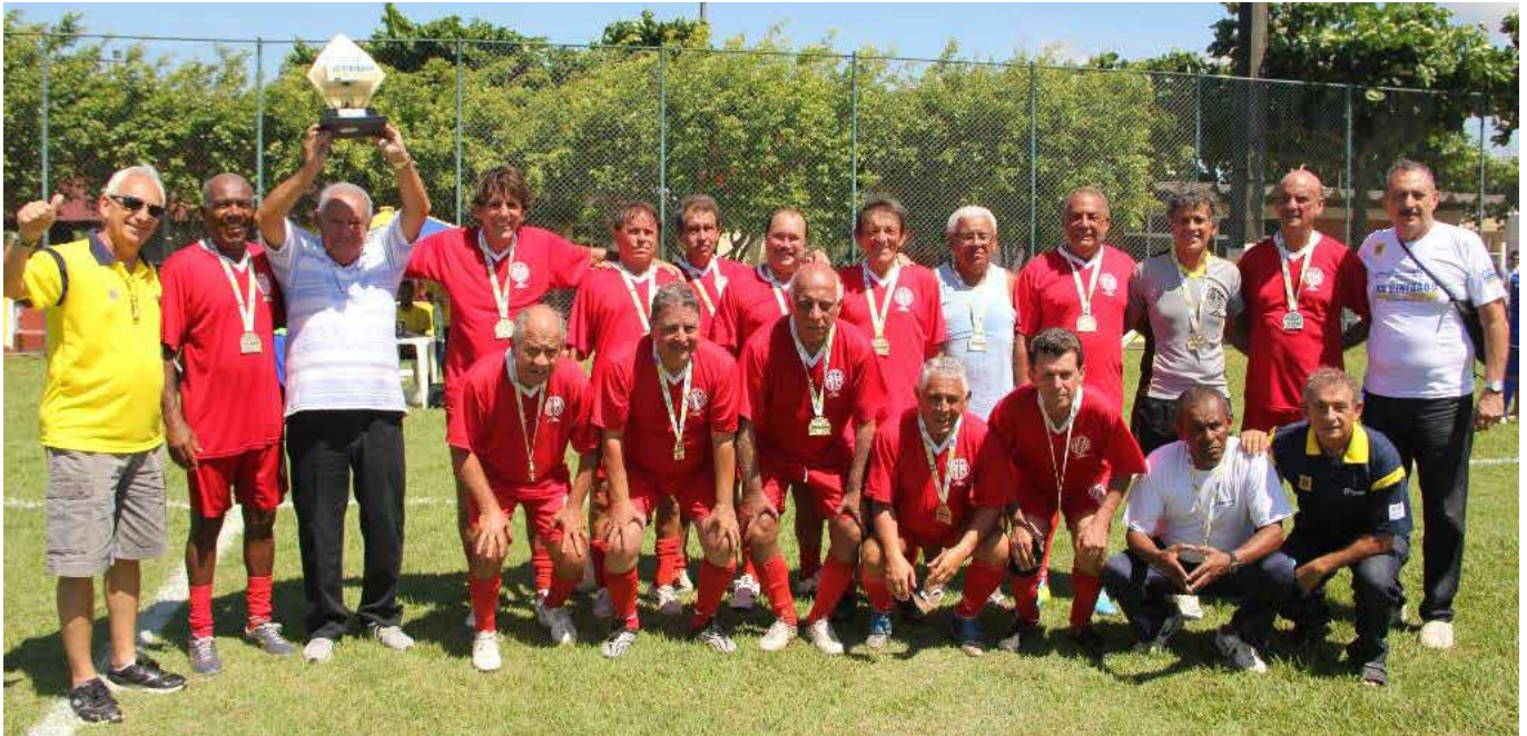
Atletas das equipes da ABB-Rio

O XXII Campeonato de Integração Nacional dos Funcionários Aposentados do Banco do Brasil patrocinado pela FENABB foi realizado entre os dias 21 e 28 de maio, na ABB Cuiabá (MT), e contou com 1.100 atletas e outros tantos de participantes familiares dos jogadores.