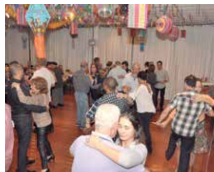
Os aniversariantes aproveitando a pista de dança