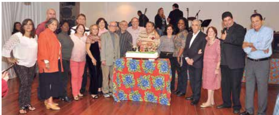
O tradicional Parabéns pra Você!!!

No segundo tempo, após as homenagens aos aniversariantes, foi ao palco a banda "Saveiro" que com um repertório de sucessos nacionais e internacionais dedicados aos namorados agradou a todos.