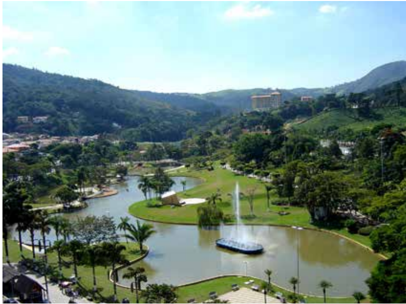
Vista parcial da cidade

No período de 14 a 18 de abril do corrente ano, em atendimento à demanda dos associados, a AABB – Rio está programando mais uma maravilhosa viagem e dessa vez à cidade de Águas de Lindóia, localizada próximo às cidades de Monte Sião (distante seis quilômetros) e Serra Negra (a dezenove quilômetros). Águas de Lindóia é um dos 11 municípios paulistas considerados estâncias hidrominerais pelo Estado de São Paulo, por cumprirem determinados pré-requisitos definidos por Lei Estadual. Tal status garante a esses municípios uma verba maior, por parte do Estado, para a promoção do turismo regional. O município adquire, também, o direito de agregar, junto a seu nome, o título de estância hidromineral, termo pelo qual passa a ser designado, tanto pelo expediente municipal oficial, quanto pelas referências estaduais. A hospedagem deverá ser no Hotel Montovani, que inclui em sua programação Noite Italiana, Baile dos Anos Dourados e outros eventos musicais.