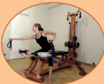
GYROTONIC, GYROTONIC® Logo and GYROTONIC EXPANSION SYSTEM são marcas registradas e são utilizadas com a autorização de Gyrotonic, Sabin Corporation.

Av. N.Sr. de Copacabana, 1183 sala 601 tel.: 98828-7703