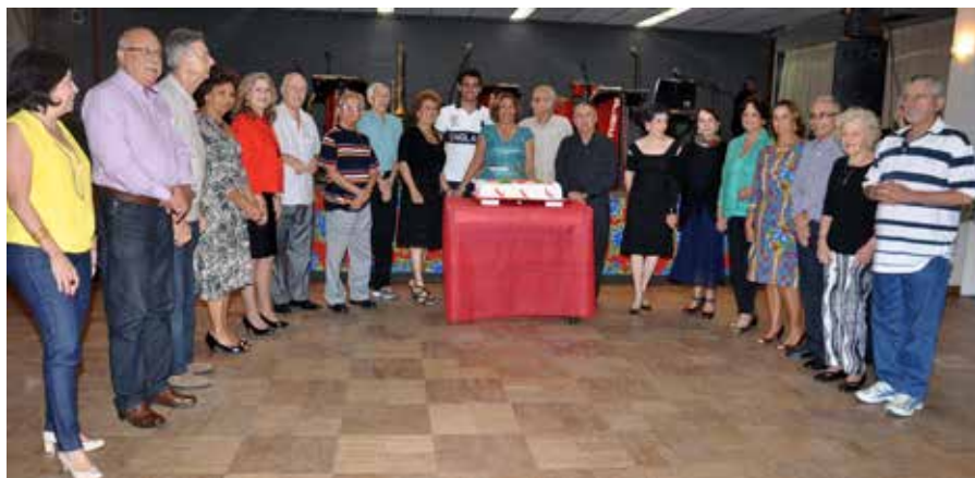
Pose dos aniversariantes para a foto oficial em torno do bolo confeitado