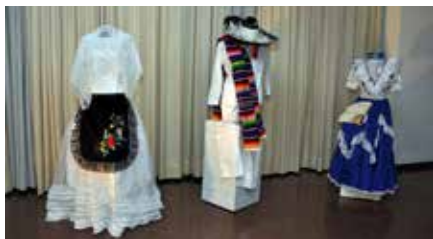
Belas vestimentas mexicanas

Em noite agradável em que predominou a exposição das tradições do México, seus costumes, seus pontos turísticos em vídeo,