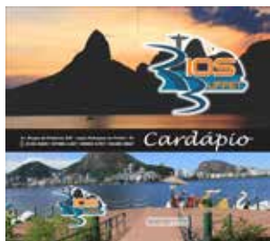
Capa do novo cardápio do dia a dia.

Qual seria o segredo do novo concessionário do setor alimentação da ABB-Rio, que em 3 meses de atividades vem agradando a grande maioria dos associados consumidores do seu variado menu de todos os dias?