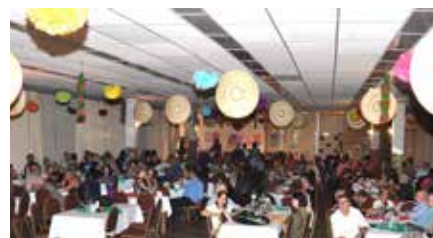
O salão Nobre regiamente ornamentado