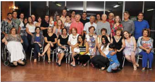
Confraternização da Escola de Dança Cristiano Salgado 2014