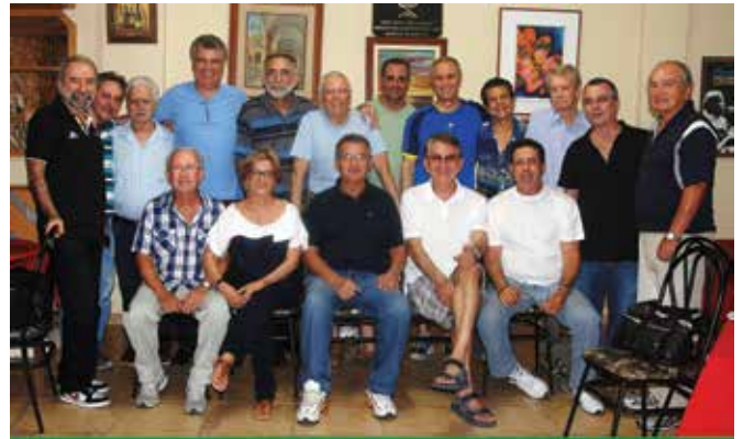
Confraternização da Sinuca da AABB Rio 2014