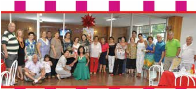
Confraternização dos Amigos de Encontros Sociais da AABB 2014