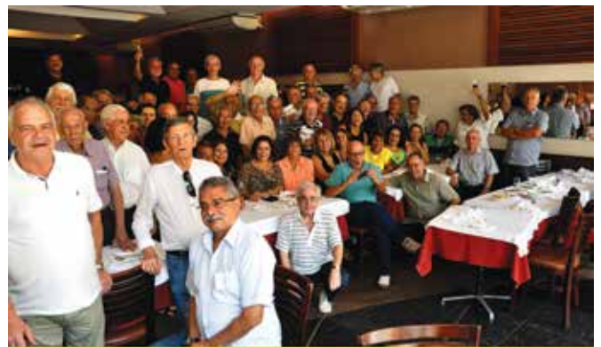
Encontro dos Aposentados da CACEX 2014