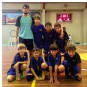
Equipe Sub-11 A

Tendo em vista o diminuto número de associados da AABB-Rio que presentemente compõem as equipes Sub-09, Sub-11 e Sub-13, a AABB-Rio de comum acordo com a equipe técnica da K-Esportes, que é a responsável pelos treinamentos dos times que representam a AABB-Rio em competições oficiais, decidiu não participar dos campeonatos organizados pela UFSERJ (União de Futsal do Estado do Rio de Janeiro), tomando-se assim sem efeito o publicado na edição anterior da Revista da AABB-Rio, nº 234, de março de 2014.