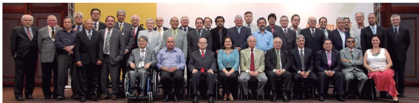
Diretoria e Delegados da Cooperforte na foto oficial após a Assembléia Geral em Brasília (DF)