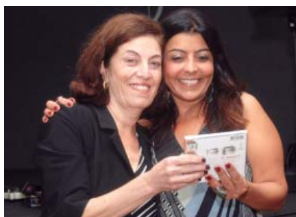
ANA (CD Chico Buarque)