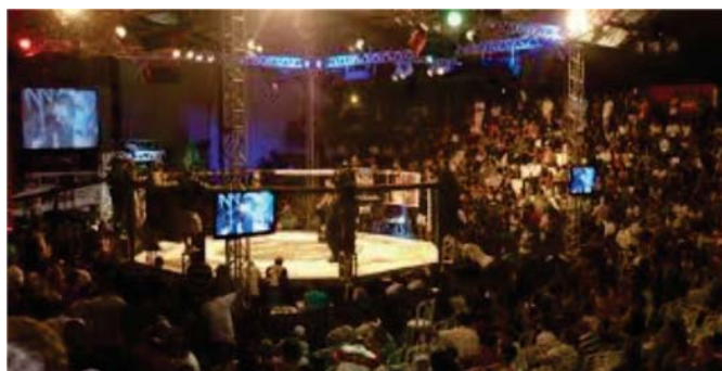
Flagrante do evento de MMA realizado no ginásio da AABB-Rio.

Foi realizado no ginásio da AABB-Rio pela primeira vez em 2013 o evento de MMA conhecido como WOCS (Watch out Combat Show) em sua 25ª Edição. O evento mais uma vez movimentou o clube com um público de aproximadamente 600 pessoas entre convidados e associados. Como é de costume o evento foi transmitido ao vivo, de forma que a AABB-Rio ficou em evidência na mídia esportiva nacional.