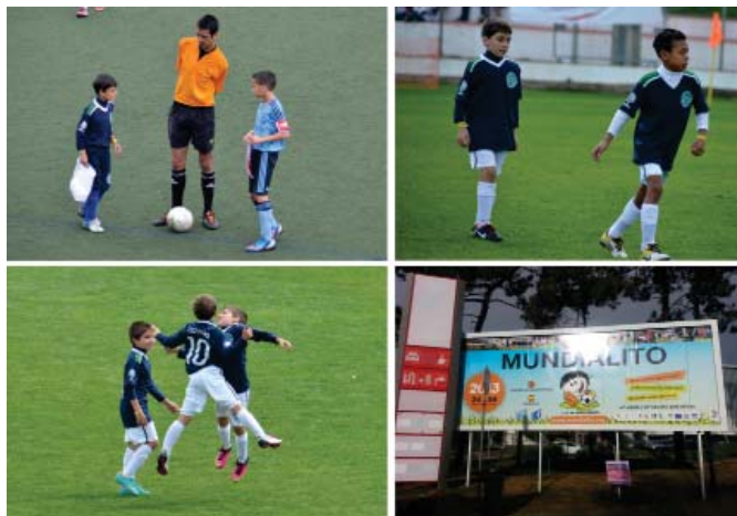
Flagrantes do pré-jogo e do out-door do evento.

nato, que teve pela segunda vez consecutiva, o Barcelona como grande campeão.