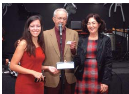
DANIELA (Máquina de Cortar Cabelo)