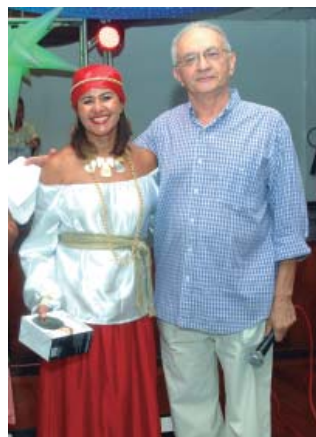
Socorro (rádio relógio)