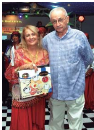
Marlene (baixela de sorvete)