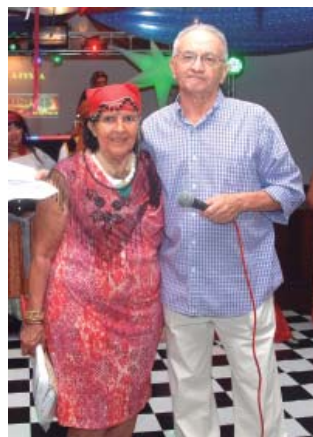
Belinha (bolsa térmica)