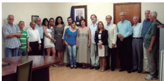
Os presentes posam após a cerimônia