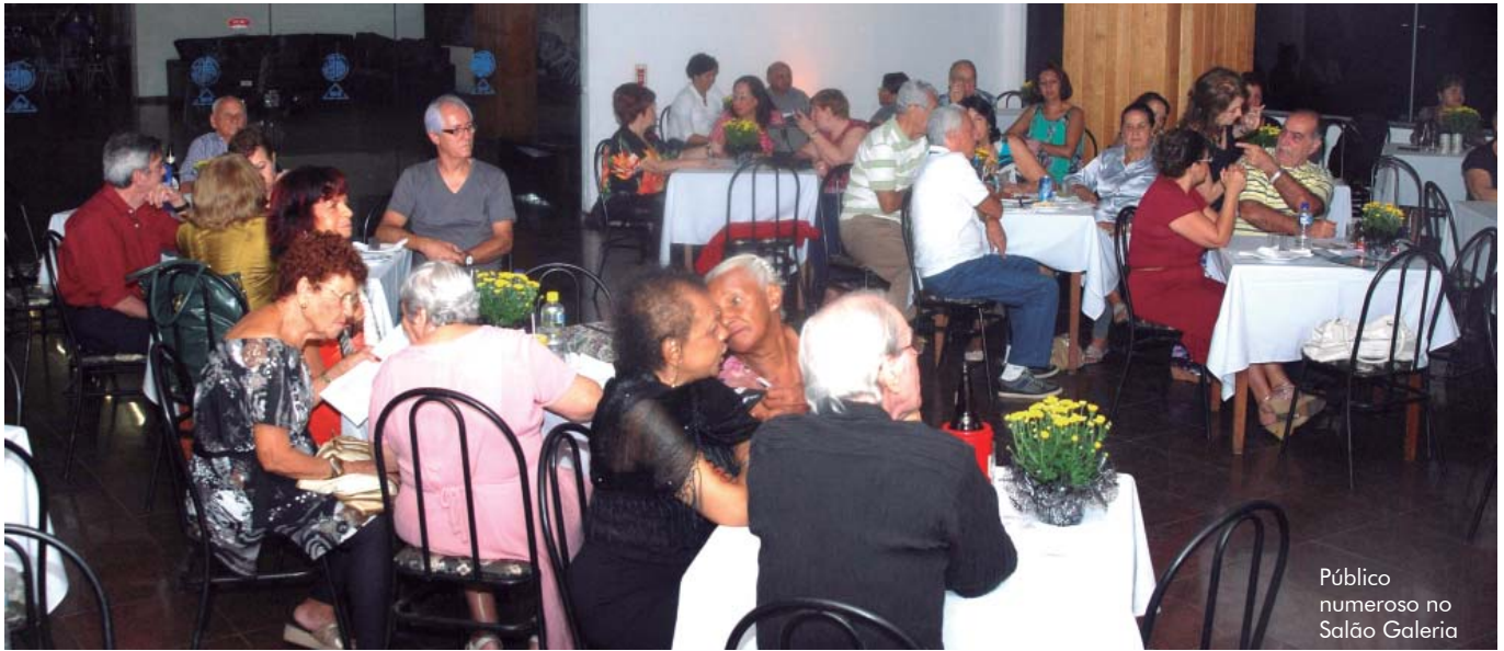
Público numeroso no Salão Galeria