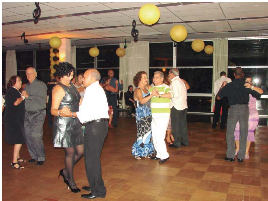
Os casais bailando no salão

A banda Status deu um toque musical de excelente qualidade botando os casais para mostrar no salão as