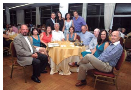
Presença dos médicos amigos da família