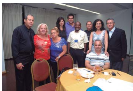
Funcionários da AABB trouxeram seu abraço