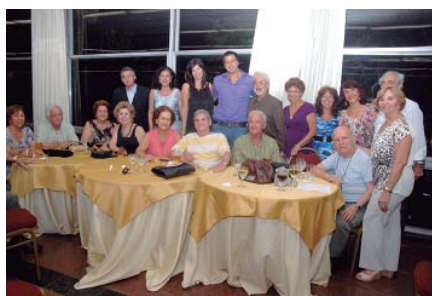
Conselheiros da AABB marcam presença