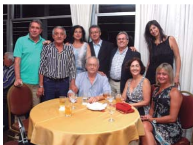
Diretoria prestigiou o evento