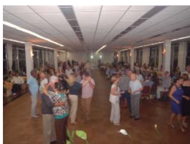
Boa música animou os dançarinos