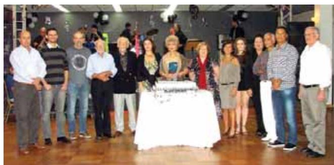
O grupo de associados aniversariantes frente ao bolo simbólico