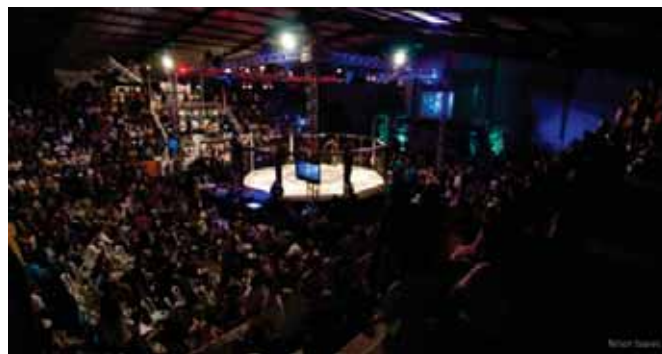
Flagrante do evento de MMA ocorrido na AABB-Rio.

No dia 27 de julho de 2012, no nosso Ginásio de Esportes, foi realizada a 20ª Edição do WOCs que teve um caráter comemorativo. Da competição participaram grandes nomes do MMA, inclusive lutadores do UFC como José Aldo, Rousimar Palhares (Toquinho) e Vitor Belfort atuando como "Corner" de um lutador, prestigiando a edição comemorativa. O evento trouxe mais