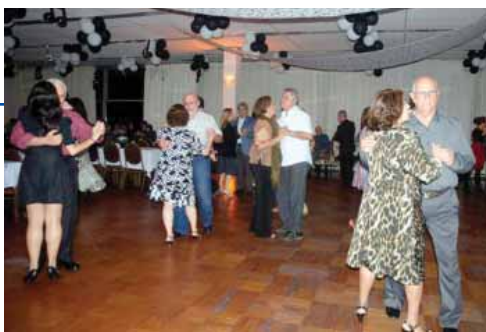
Casais aproveitam a boa música da banda