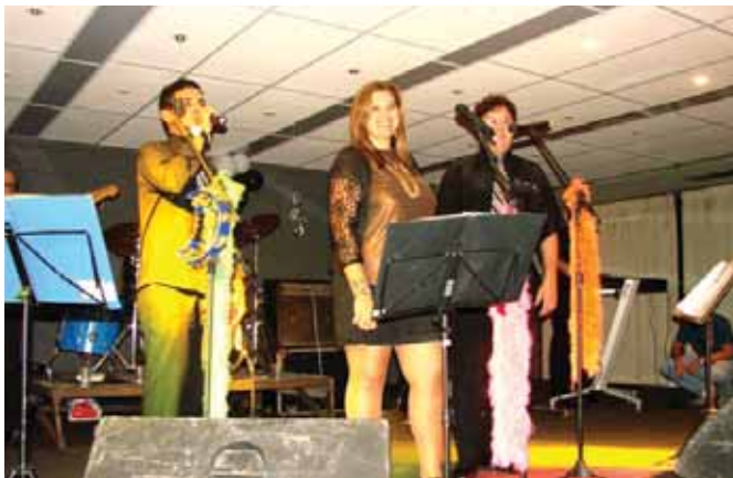
Banda Aeroporto muito bem recebida