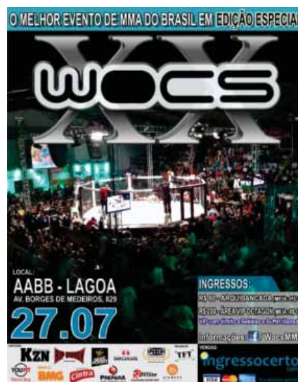
Cartaz do evento realizado no ginásio da AABB-Rio

No dia 27 de julho de 2012, no nosso Ginásio de Esportes, foi realizada a 20ª Edição do WOCs que teve um caráter comemorativo. Da competição participaram grandes nomes do MMA, inclusive lutadores do UFC como José Aldo, Rousimar Palhares (Toquinho) e Vitor Belfort atuando como "Corner" de um lutador, prestigiando a edição comemorativa. O evento trouxe mais