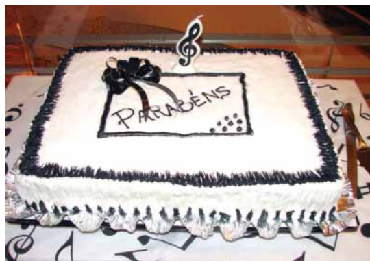
O bolo artisticamente confeitado