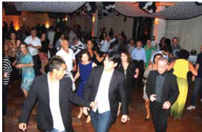
Dançarinos da Academia numa alegria contagiante