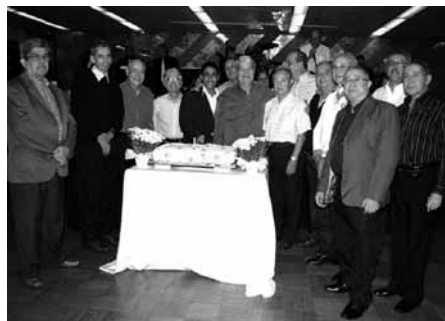
O pelotão masculino em pose à frente do bolo comemorativo