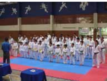
II Festival TKDRio de Taekwondo - Poomsae