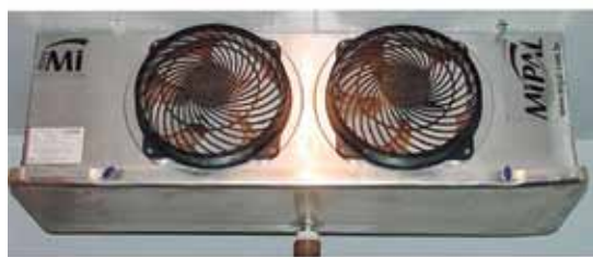
Detalhe interno da nova Câmara Frigorífica

Essa é a ideia, continuar investindo em tecnologia, com aquisição de produtos que embora não tenham visibilidade, proporcionam a VOCÊ, associado, melhorias na qualidade dos serviços oferecidos.