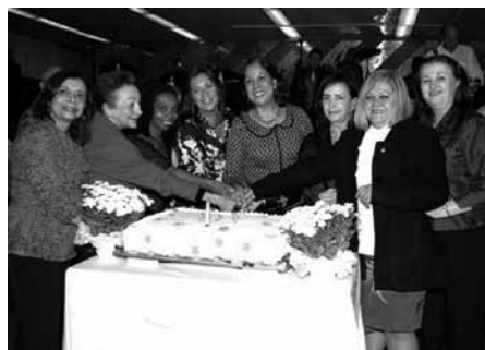
O bolo comemorativo é cortado pelo grupo feminino