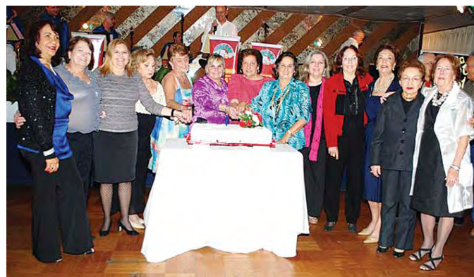
Grupo feminino no momento do corte simbólico do bolo comemorativo