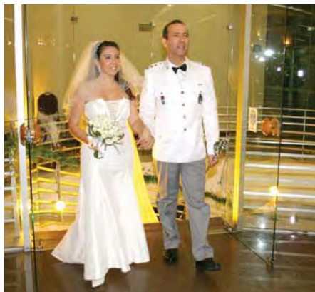
O casal na entrada triunfante no salão da AABB