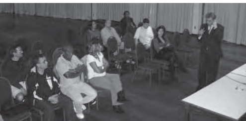
Palestra Etiqueta Empresarial – Social