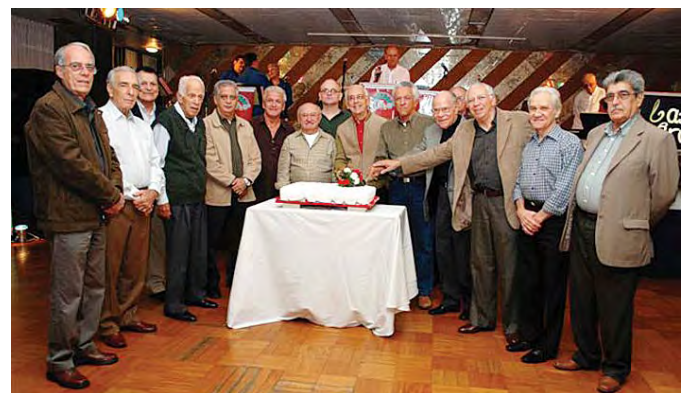
Pelotão masculino prepara a investida sobre o bolo confeitado