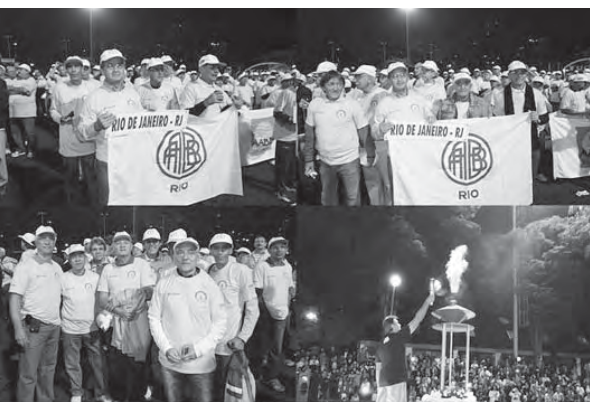
Cerimônia de Abertura CINFAABB 2011 – São Paulo/SP Delegação AABBRio e acendimento da pira olímpica