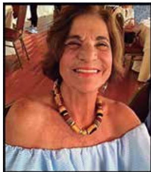
*Por Aciléa Pinto da Cunha

Pediram ao poeta que definisse o que é amor.