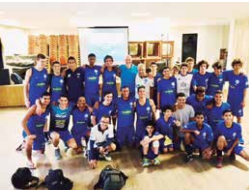
A equipe toda reunida