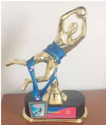
Troféu pela defesa menos vazada

No dia 01 de julho de 2018 a equipe AAB/K Esportes de Futsal, sagrou-se Vice-campeã do Campeonato Carioca - série Prata - categoria sub 13. O jogo foi realizado na Vila Olímpica de Caxias, contra o time do Fluminense e para alegria dos professores, a equipe ainda levou o troféu de defesa menos vazada. Parabéns meninos!!!