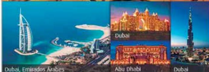
Dubai, Emirados Árabes