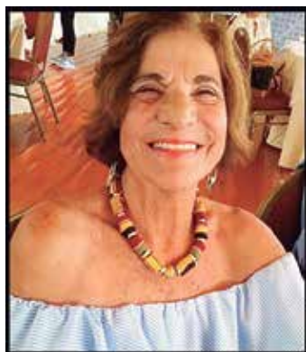
*Por Aciléa Pinto da Cunha

Nascemos um bebê lindo, risonho e feliz. Passamos a crianças cheias de vida e travessas, em seguida nos tornamos adolescentes, nos defrontando com livros, deveres e obrigações escolares.