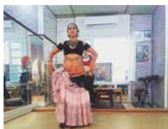
ATS - American Tribal Style