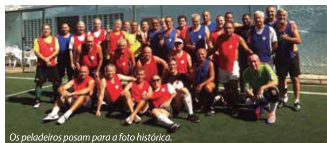
Os peladeiros posam para a foto histórica.

Os craques veteranos do futebol fizeram sua festa natalina que terminou em churrasco.