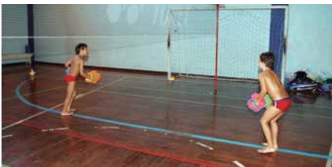
O jogo das crianças

A equipe do Zaccaro Ball está convidando o associado da AABB-Rio e das AABBs do País, para adotarem esse novo esporte oferecendo oficinas gratuitamente aos interessados.