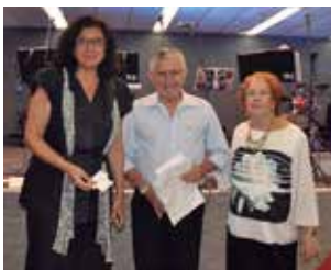
Estela - 01 mês de Yoga