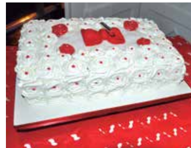
O tradicional bolo dos aniversariantes