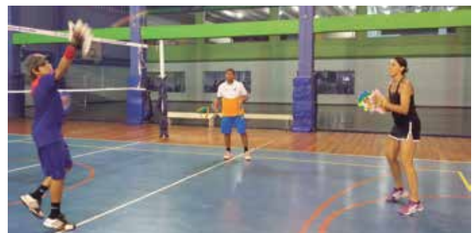
Jogo de adultos