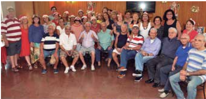
CONFRATERNIZAÇÃO DO GRUPO DO SOFÁ