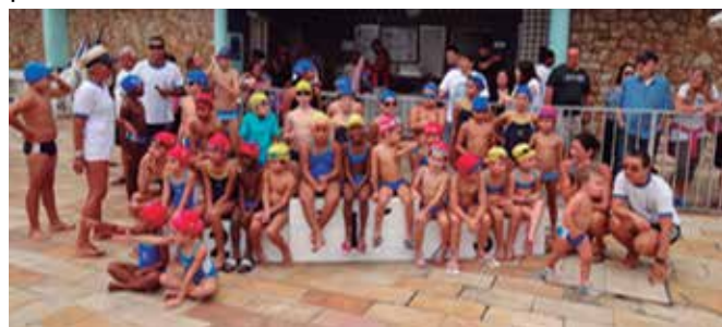
Último Festival de Pranchinhas do ano de 2015.

Dia 5 de dezembro, realizou-se a última competição do ano da escola de natação Equipe 8 - AABR-Rio. Apesar do tempo foi um sucesso, nossas crianças quem sabe futuros atletas, adentraram ao parque aquático nadaram e conquistaram suas medalhas. Ao final foi proporcionado pelos pais, um lanche coletivo.