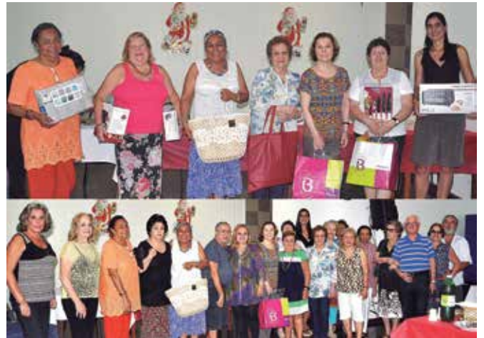
Confraternização de Natal do Bingo Social