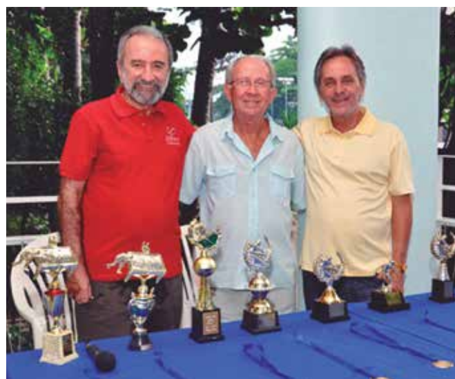
A Coordenação da Sinuca antes da entrega dos prêmios.

Usando da palavra os dirigentes citados agradeceram a participação dos associados nos campeonatos realizados durante 2015, dizendo que a eles se deve o sucesso desses torneios e finalizaram fazendo votos de boas festas e desejando um ótimo 2016 olímpico.