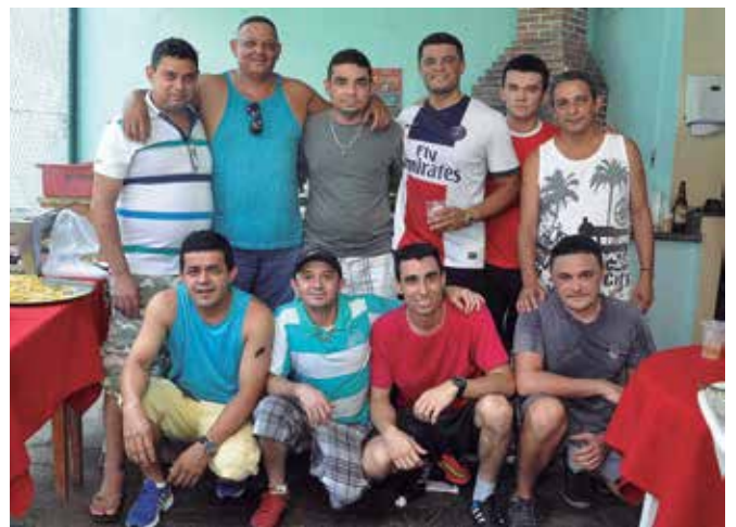
Confraternização de Natal do Rio's Buffet