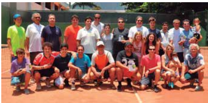
Confraternização com os participantes, ganhadores e seus familiares.

do torneio pela primeira vez com seus parentes e o departamento de organização.