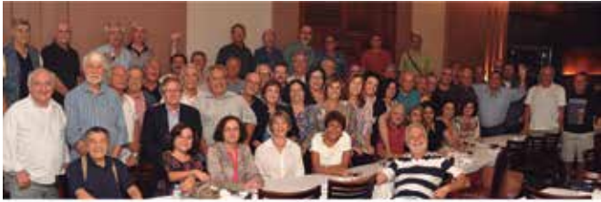
ENCONTRO DOS APOSENTADOS DA CACEX 2015