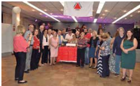
O Parabéns pra Você!!!