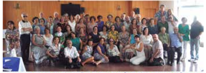
CONFRATERNIZAÇÃO DA GINÁSTICA ENERGÉTICA