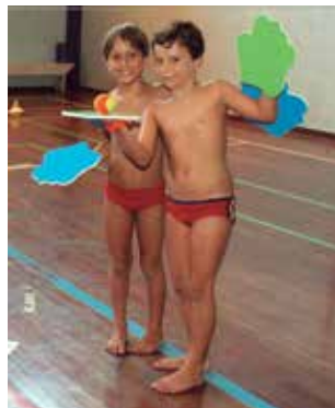
Raquete infantil das mãos

“A prática de esportes é fundamental para a saúde e o bem-estar do ser humano seja ela destinada à criança ao