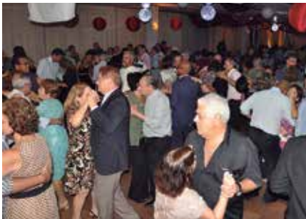
A pista de dança lotada