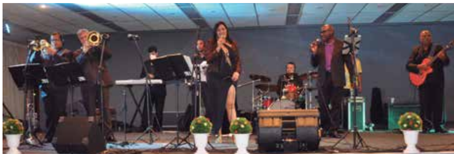
Show da banda Alto Astral!

O sotaque mineiro era lembrado sempre com um repetido “uai”, nos grupos que saudavam a movimentada programação. E veio a solene reunião dos homenageados, cantando o tradicional “parabéns para você”, diante de um bolo confeitado e o retorno aos embalos das coreografias ensaiadas pelos dançarinos das danças de salão.