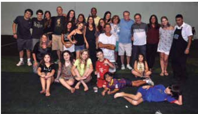
GRUPO DAS SEXTA EM CONFRATERNIZAÇÃO