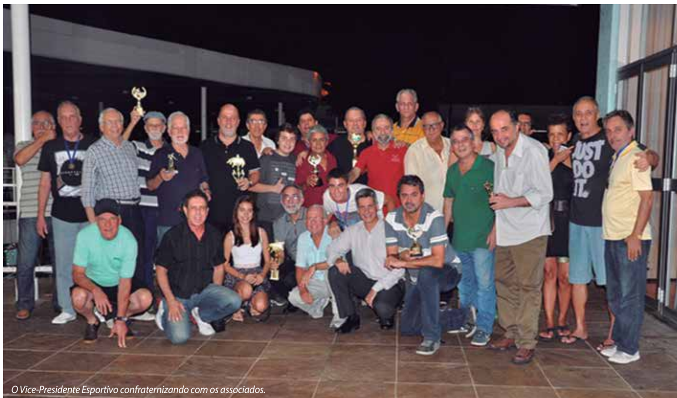
O Vice-Presidente Esportivo confraternizando com os associados.

Encerrando as atividades deste ano, associados e frequentadores do Salão de Sinuca estiveram presentes ao evento de confraternização realizado no dia 09.12.2015 nas dependências do Clube.