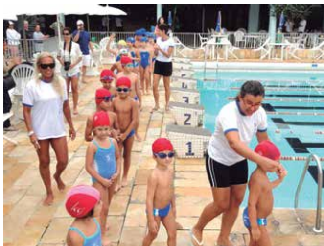
Flagrante do evento comemorativo do Dia da Criança da Escola de Natação Equipe 8

Em comemoração ao Dia das Crianças, a Escola de Natação Equipe 8 realizou na quinta-feira dia 11 de outubro um animado e descontraído evento para os pequenos alunos no complexo aquático da AABB-Rio. O evento contou com diversas atividades