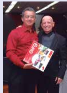
Odali - jogo de Baixela