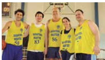
Equipe terceira colocada: Os Falcões

O GVBAR- Grupo de Veteranos de Basquetebol da AABB-Rio realizou o Torneio de Apresentação no último dia 29 de setembro, com a participação de 32 atletas divididos pelas 04 tradicionais equipes que compõem o mesmo: Anjos da Noite, Búfalos, Falcões e Stars, que disputaram jogos com duração de dois tempos de 10 minutos corridos, onde todas as equipes se