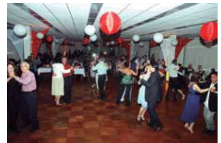
Os aniversariantes comemoram na pista de dança