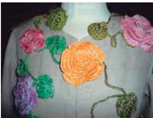
Rosa em crochê