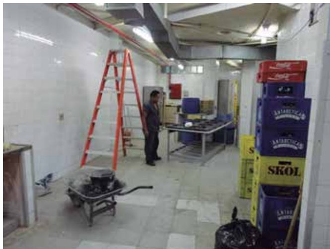
Tomada das dependências da lixeira reformada