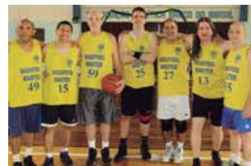
Equipe Campeã: Os Anjos da Noite