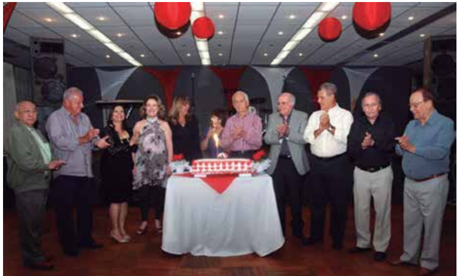
Aniversariantes de outubro em torno do bolo confeitado

Os presentes não foram esquecidos e por sorteio ganharam interessantes brindes, oferecidos pela Diretoria e pelos vários prestadores de serviços instalados no Clube, como o Salão de Beleza "Lagoa's Coiffeur", "Shiva Empresa de Terapia de Yoga e Fonoaudiologia", "Academia Pro-quality" e Espaço de Dança "Cristiano Salgado".