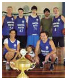
Equipe quarta colocada: Os Stars