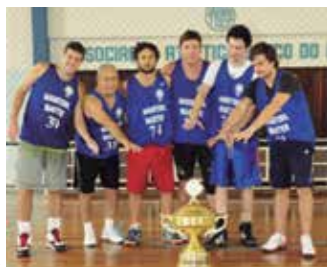
Equipe Vice-campeã: Os Búfalos