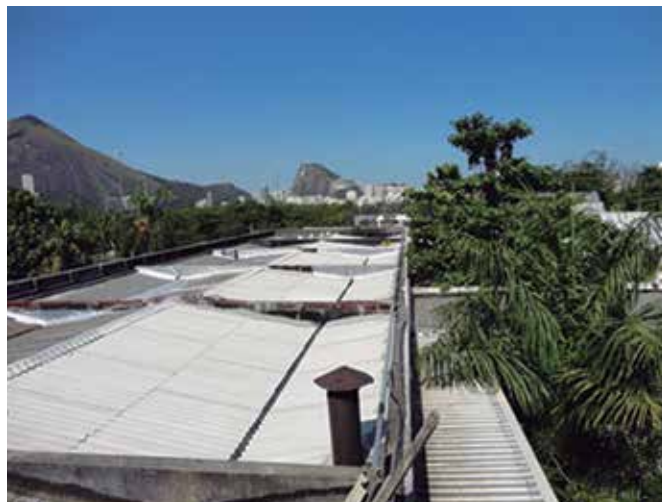
Vista do telhado que recebeu a reestruturação.