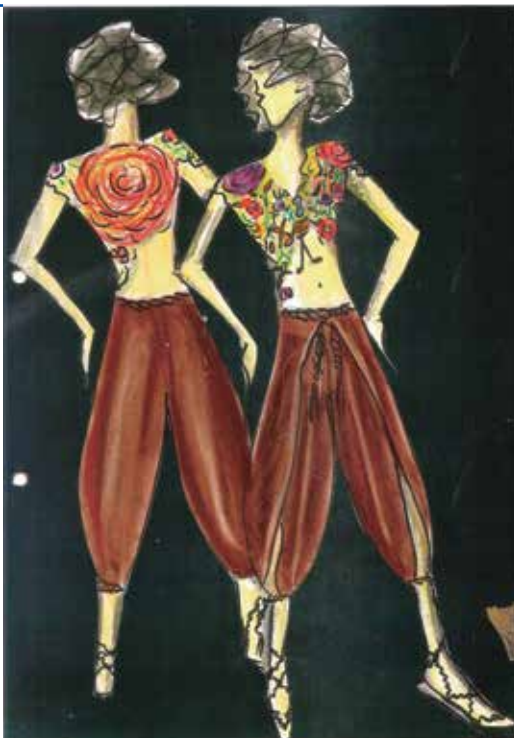
Croquis de um colete e calça